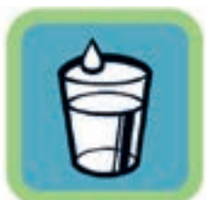
пей чистую воду