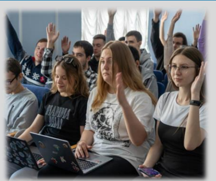
Стань студентом на один день