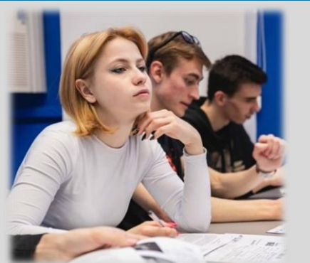
Интенсив от СГТУ

ПРОФЕССИОНАЛЬНЫЕ ПРОБЫ: «Попробуй себя в профессии!»