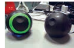
Кадр из видео YouTube/Lehu — искусственный интеллект у вас дома!