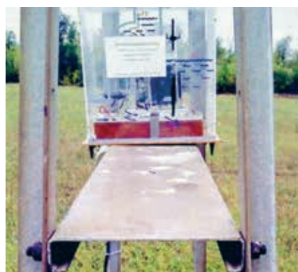
Блок для контроля работы дождевальной машины по мобильной связи на опорной тележке