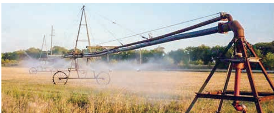
Многофункциональная дождевальная машина «Волга-С» с полиэтиленовым трубопроводом в работе