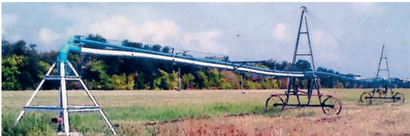
Общий вид опытного образца многофункциональной дождевальной машины «Волга-С» с полиэтиленовым трубопроводом