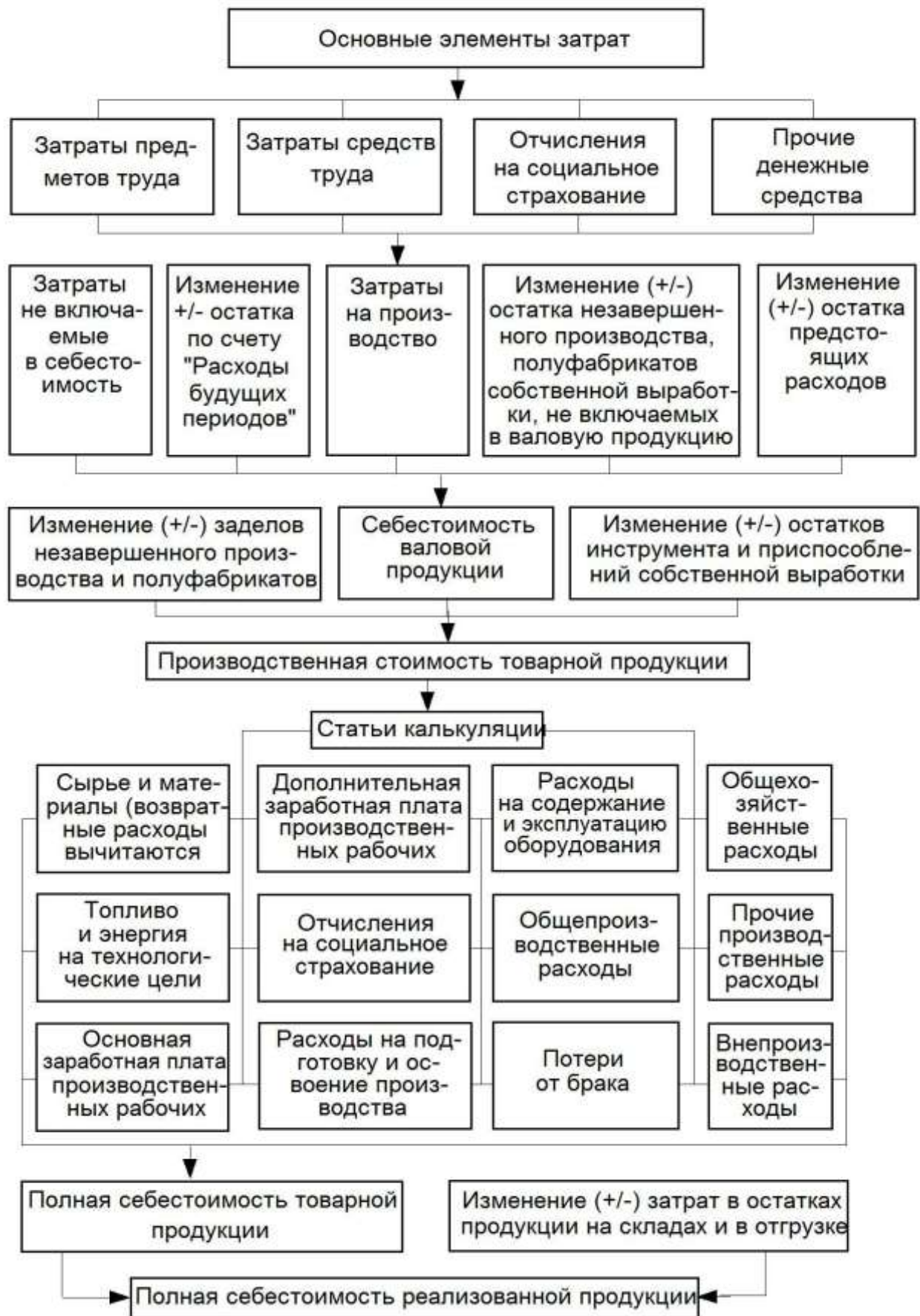
Схема формирования себестоимости