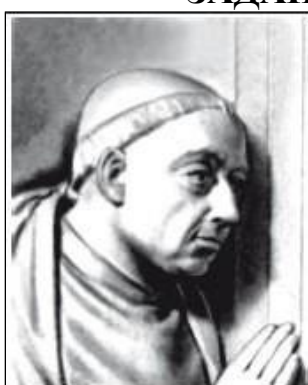
Николай Кузанский 1401 – 1464

С помощью графического рисунка объясните идею пантеизма, автором которой является итальянский философ Николай Кузанский (1401-1461).