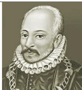
Мишель де Монтень

Девизом французского мыслителя Мишеля Монтеня (1533 – 1592) были слова «Точно известно, что ничего точно не известно». Раскройте их смысл.