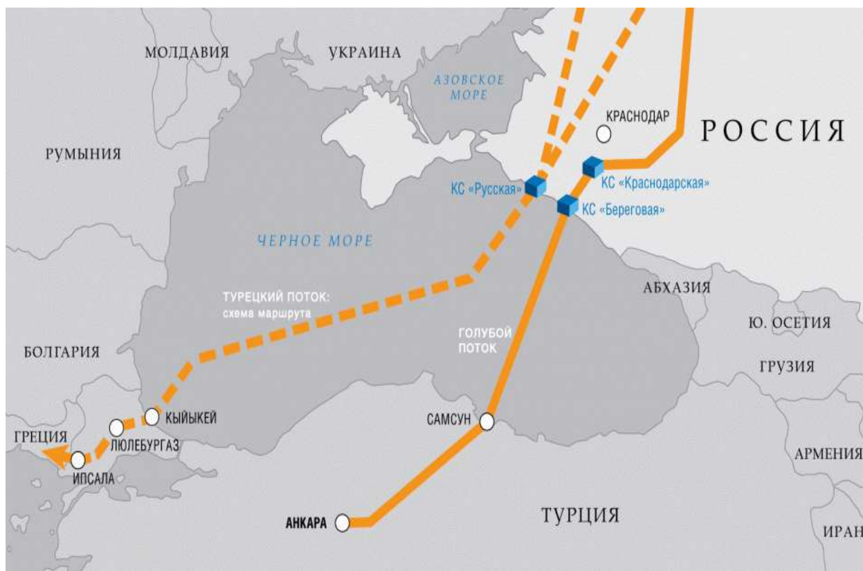
Рисунок 1 – Проект газопровода Турецкий поток