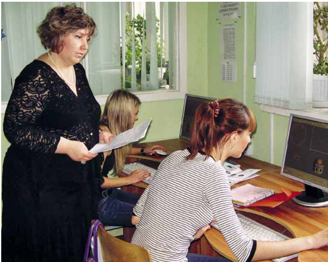
Занятия по основам геометрического моделирования в графическом редакторе 3D MAX

В 1965 году на кафедре был разработан и реализован учебный курс «Основы художественного конструирования», который позднее был назван «Основы дизайна». Дисци-