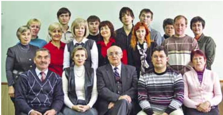
Кафедра НГиКГ. 2011 год

плина «Основы дизайна» изучалась студентами всех технических специальностей. В рамках данного курса студенты постигли основы композиции, колористику и эргономику, приобретали навыки решения вопросов в области художественного конструирования, что, в конечном счете, способствовало развитию творческого потенциала личности будущих инженеров и восприятию ими общекультурных ценностей.