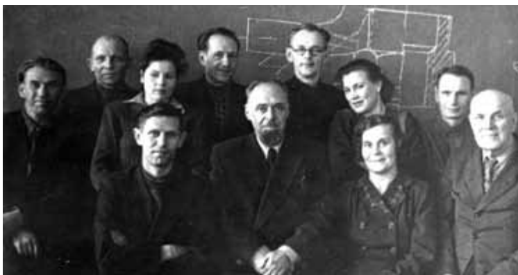
Кафедра графики. 1931 год