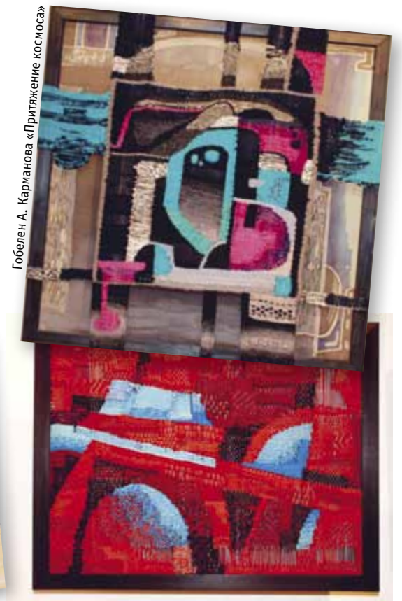
Гобелен А. Карманова «Синее солнце»