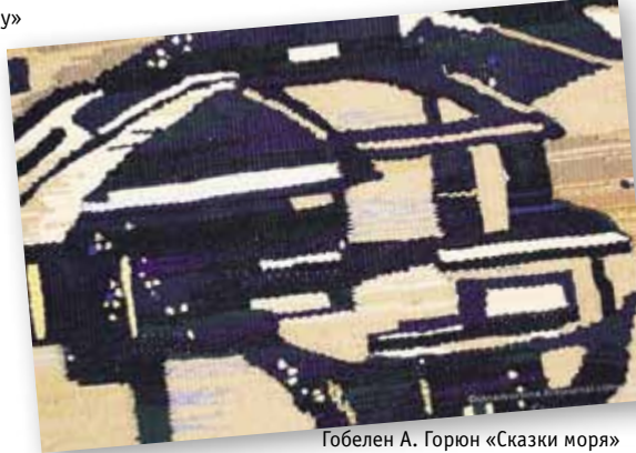
Гобелен А. Горюн «Сказки моря»

Выставка лауреатов и участников Первого триеннале гобелена России состоится в залах Саратовского отделения Союза художников России в декабре 2011 года.